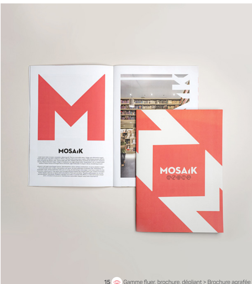
15 Gamme flyer, brochure, dépliant &gt; Brochure agrafée

9 x 5 x 10 cm 400g carton blanc demi-mat Pelliculage mat Soft Touch recto Quadri recto-verso