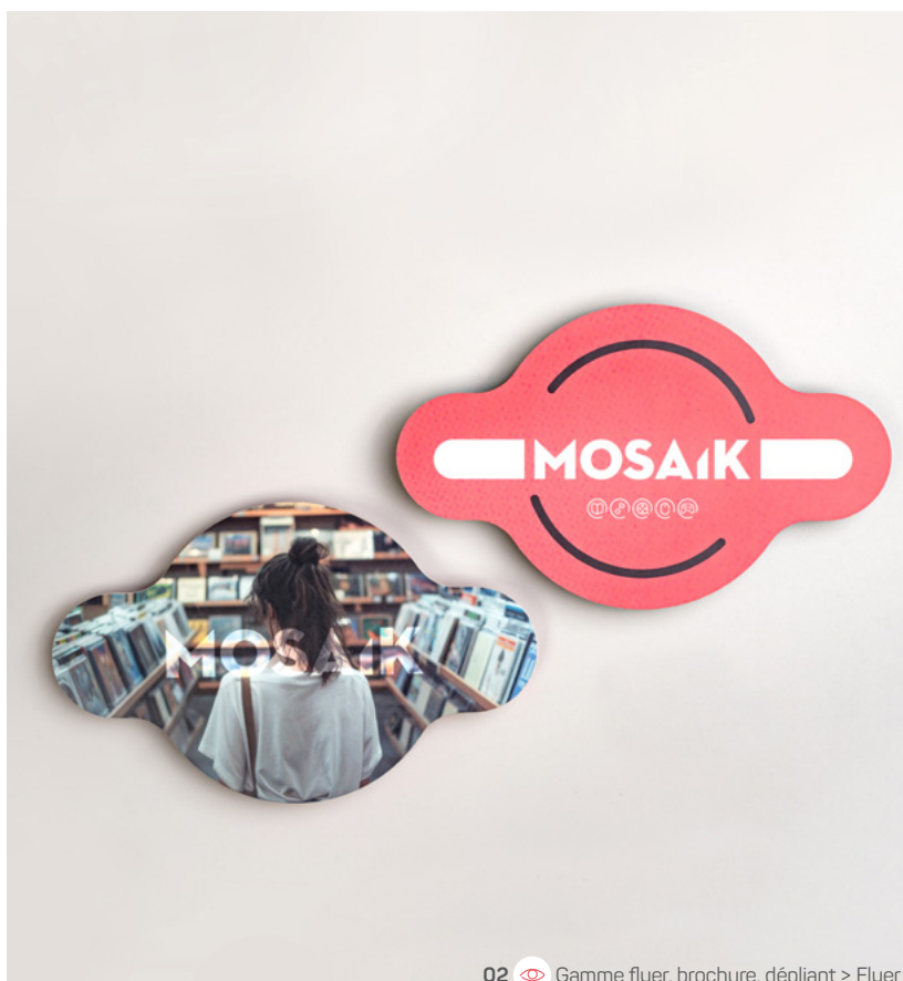
02 Gamme flyer, brochure, dépliant > Flyer

Dans le secteur du retail, chaque détail contribue à construire une relation durable avec le client. Une brochure soignée, un flyer original ou une carte de fidélité bien pensée renforcent la crédibilité d'un lieu et la qualité perçue de son offre. Offrez une expérience cohérente et raffinée dès le premier contact.