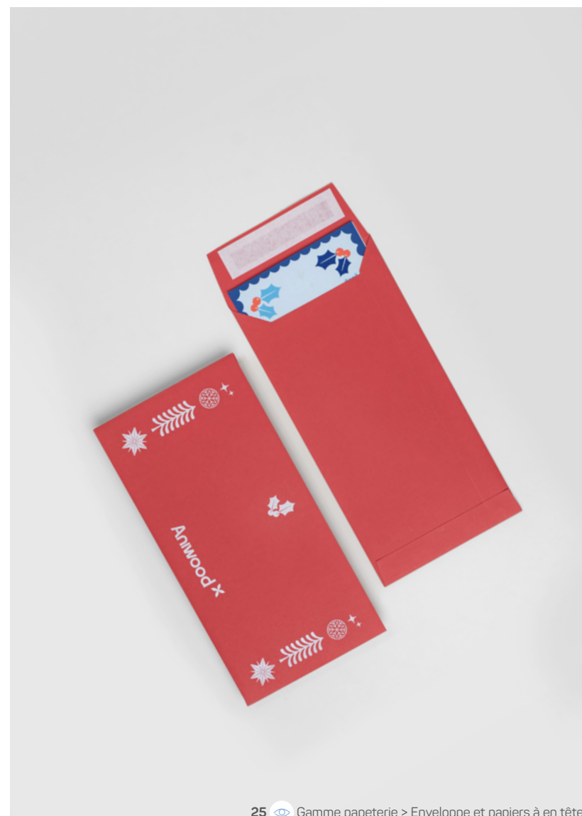
25 Gamme papeterie > Enveloppe et papiers à en tête