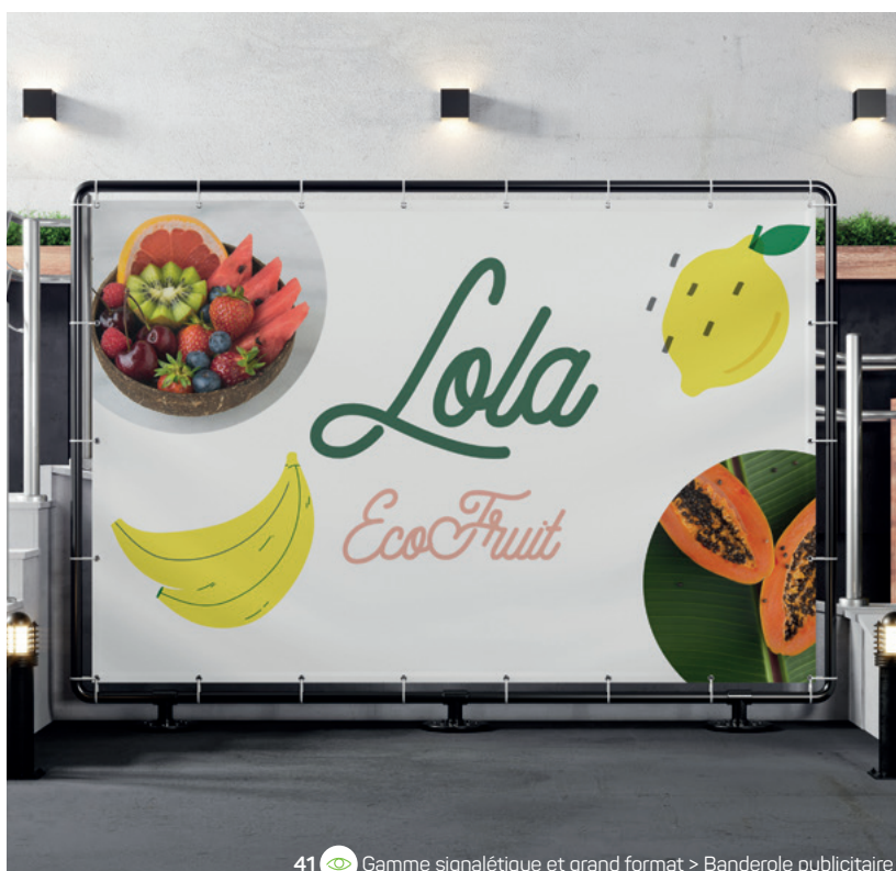
41 Gamme signalétique et grand format > Banderole publicitaire