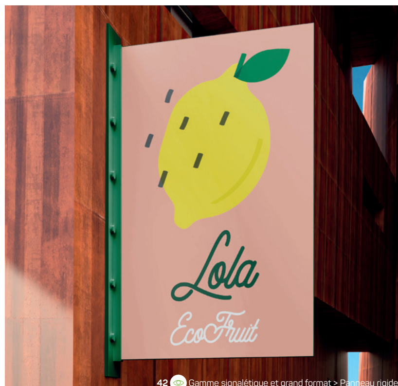
42 Gamme signalétique et grand format > Panneau rigide