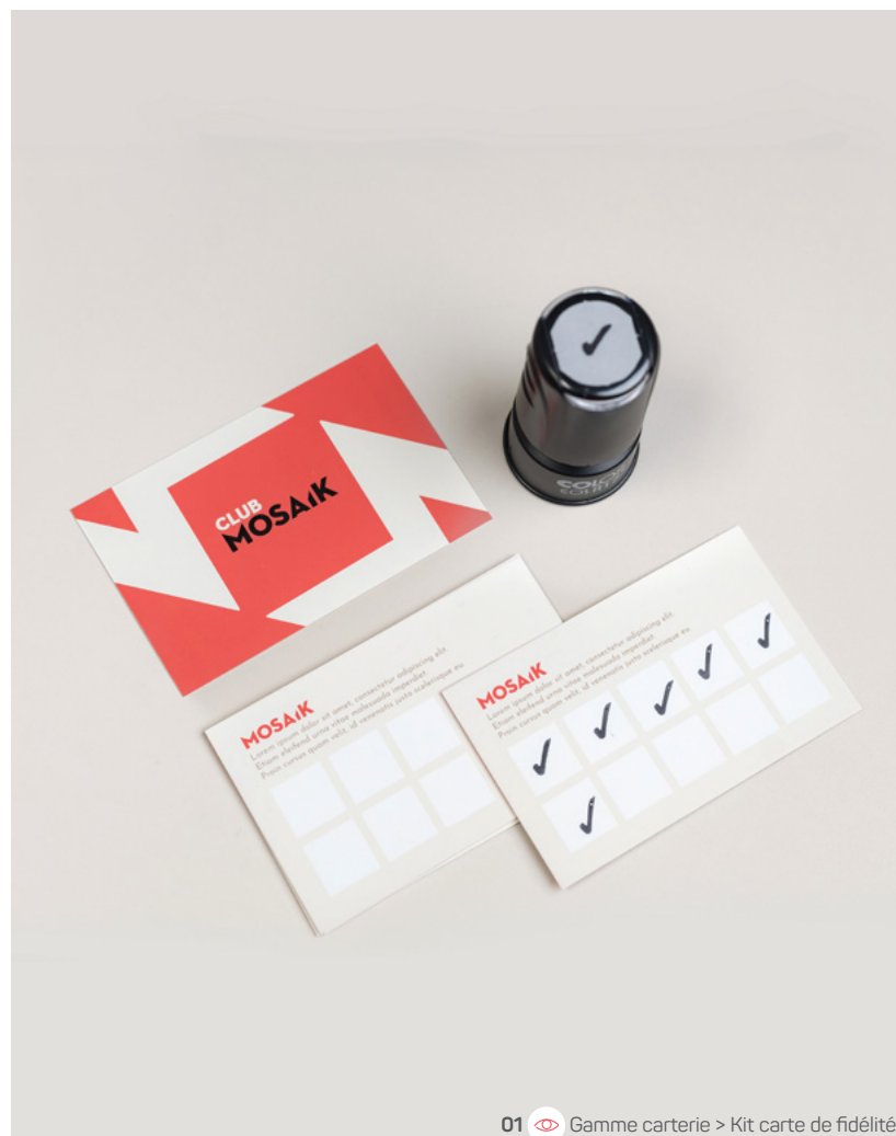
01 Gamme carterie > Kit carte de fidélité