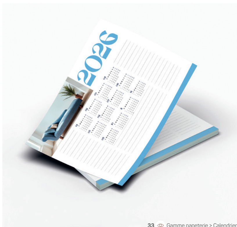
33 Gamme papeterie > Calendrier

Objet utile du quotidien, le calendrier reste un incontournable. Qu'il soit mural, de bureau ou chevalet, à spirale ou en bloc, il s'adapte à tous les univers et peut devenir un véritable support de communication. À personnaliser ou à imprimer, chaque modèle vous permet de marquer les esprits... 365 jours par an.