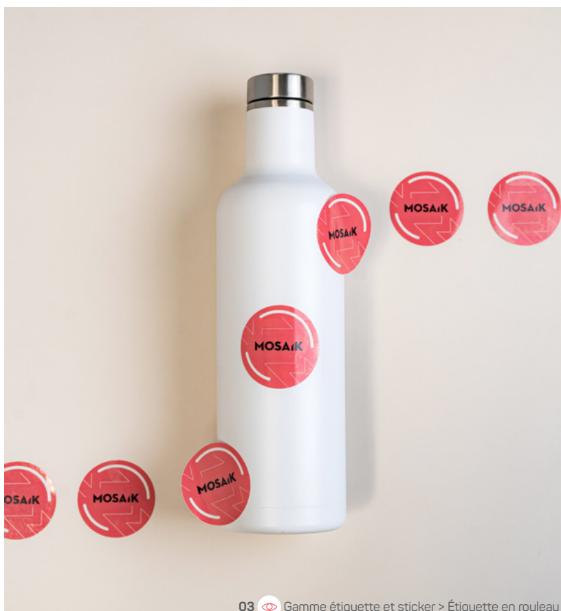
03 Gamme étiquette et sticker > Étiquette en rouleau

8,5 x 5,4 cm 300g kraft Perforation de 4 mm Quadri recto-verso