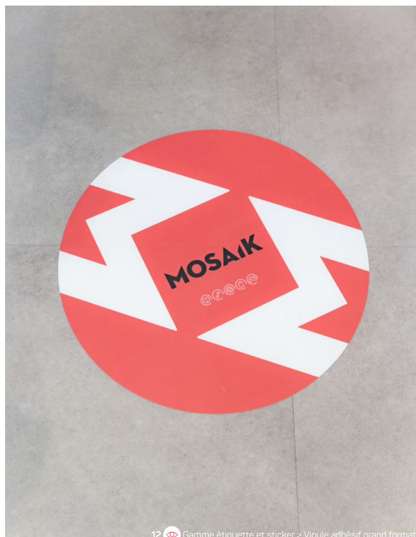
12 Gamme étiquette et sticker > Vinyle adhésif grand format