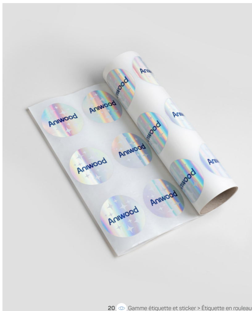
20 Gamme étiquette et sticker > Étiquette en rouleau