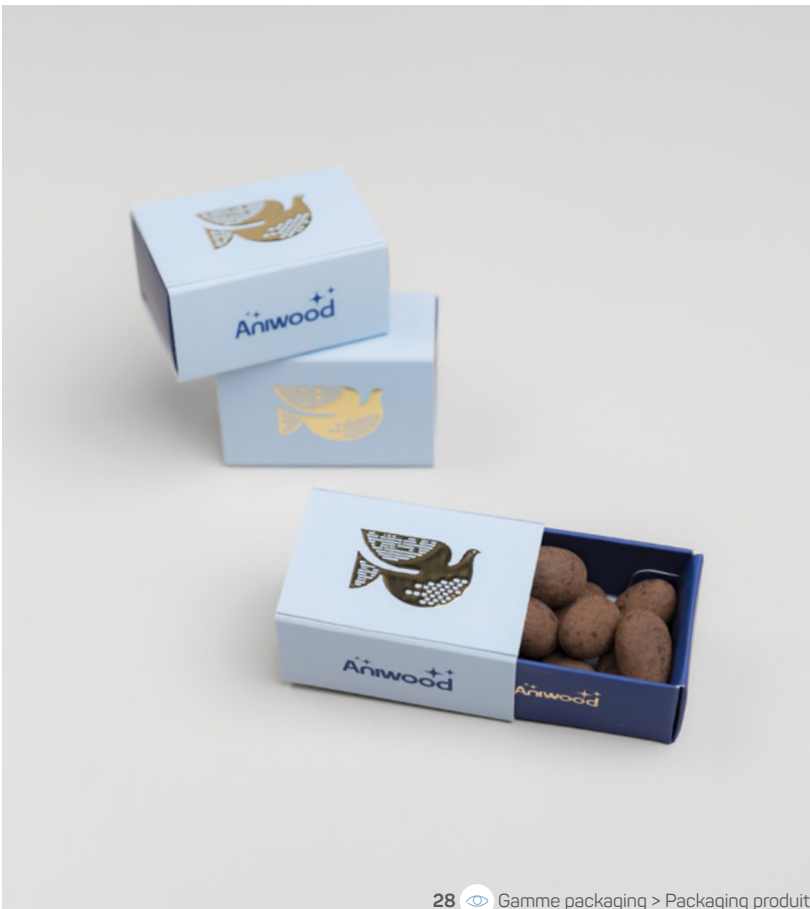
28 Gamme packaging &gt; Packaging produit