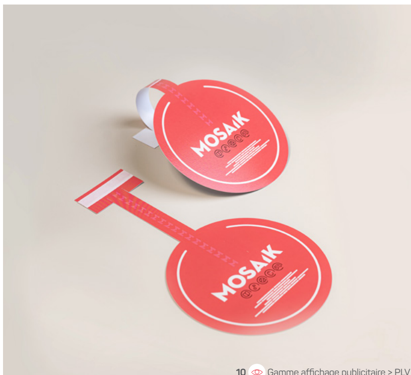
10 Gamme affichage publicitaire > PLV