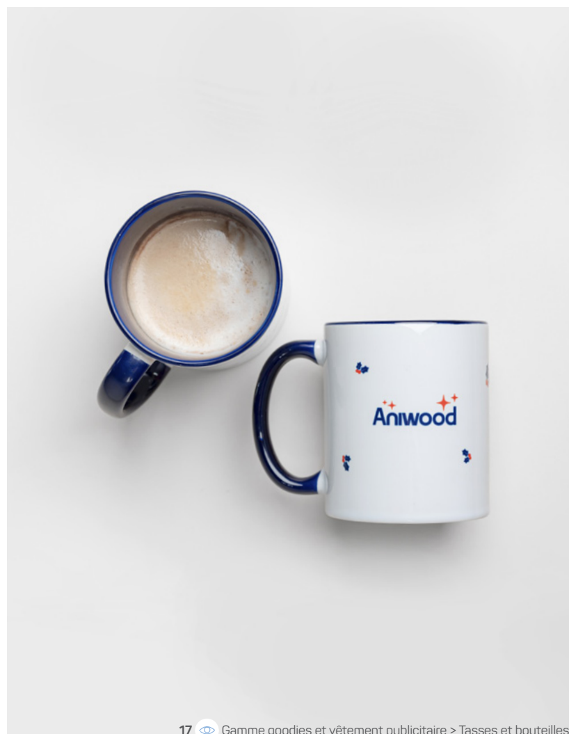
17 Gamme goodies et vêtement publicitaire > Tasses et bouteilles

La fin d'année est un moment clé pour valoriser vos produits, fidéliser vos clients ou marquer les esprits avec un geste soigné. Qu'il s'agisse de packagings personnalisés, de cartes de vœux élégantes ou d'objets à offrir, l'imprimé devient vecteur d'émotion, d'image et de mémorisation. Autant de raisons d'en faire un outil de communication à part entière.