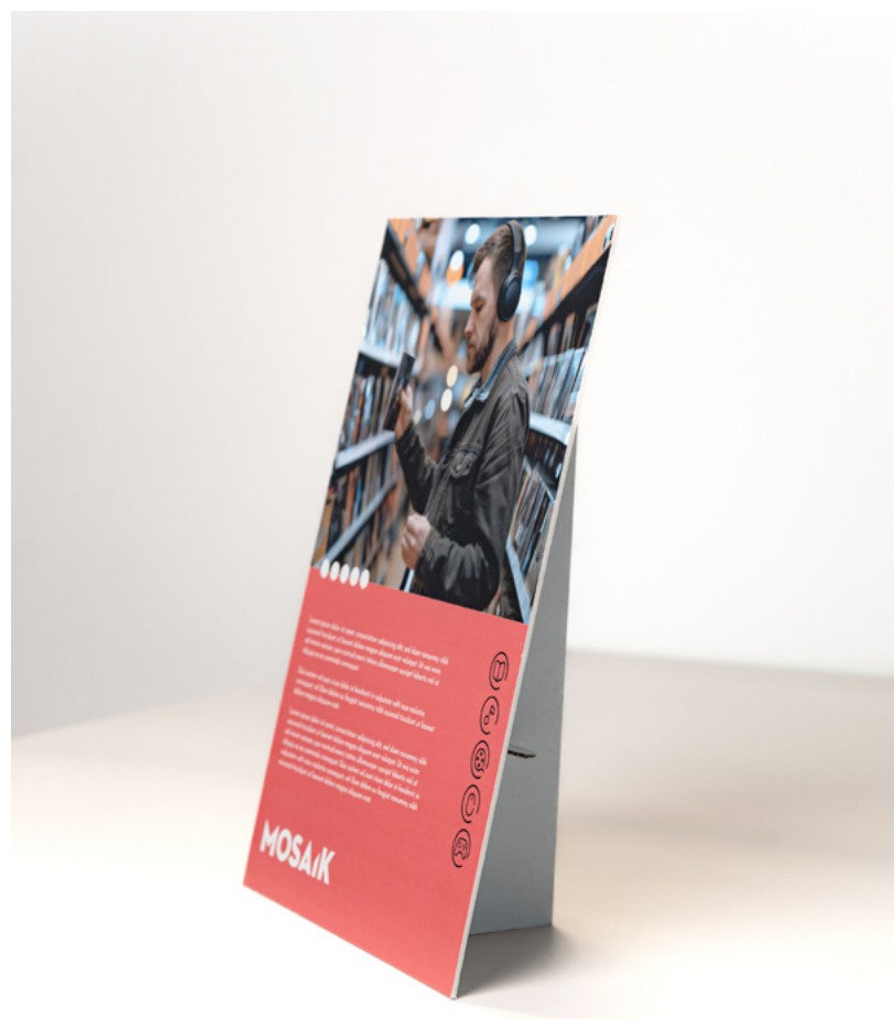
05 Gamme affichage publicitaire > PLV