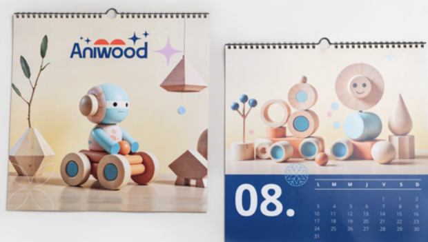
22 Gamme papeterie > Calendrier