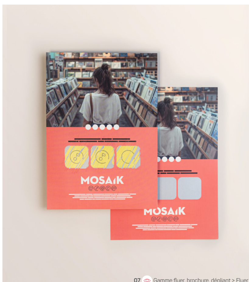
07 Gamme flyer, brochure, dépliant > Flyer