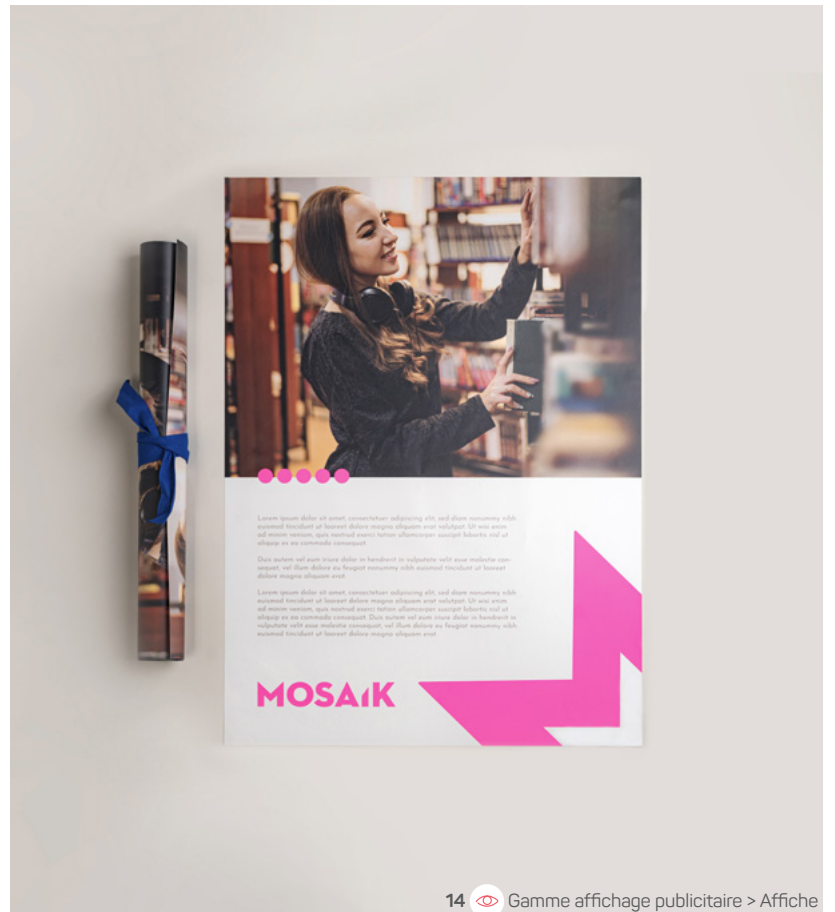
14 Gamme affichage publicitaire &gt; Affiche