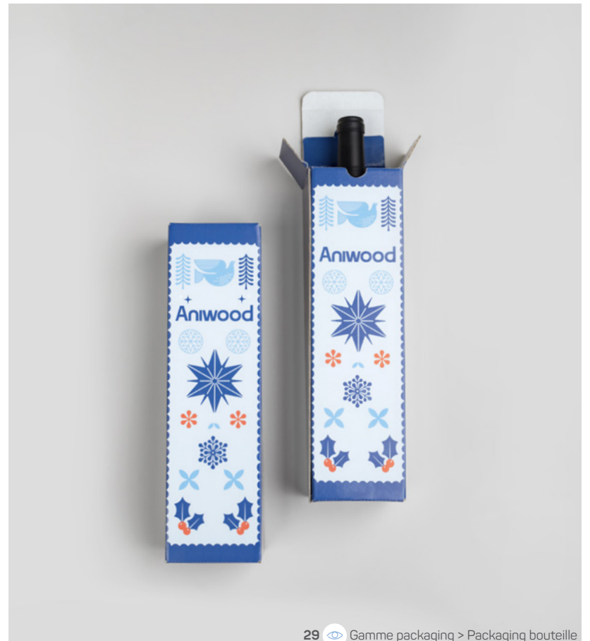
29 Gamme packaging &gt; Packaging bouteille