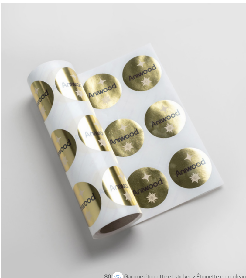
30 Gamme étiquette et sticker &gt; Étiquette en rouleau

100 x 75 cm 90g kraft blond Quadri recto