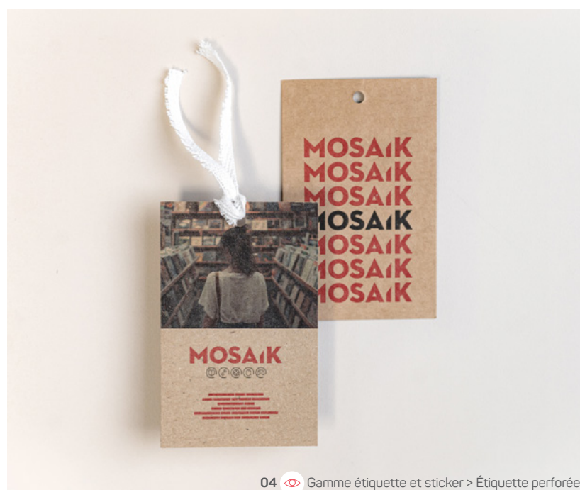
04 Gamme étiquette et sticker > Étiquette perforée