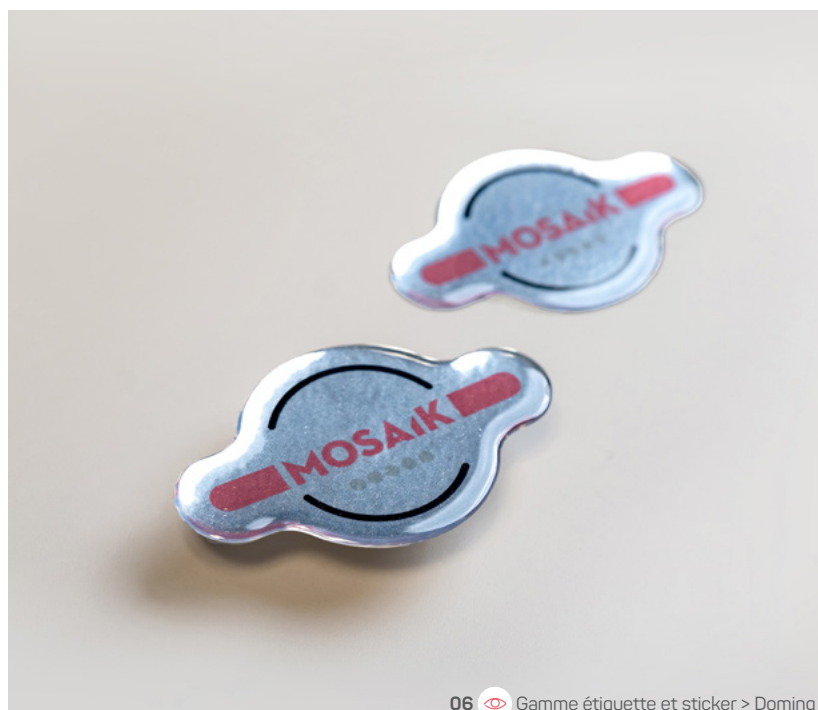
06 Gamme étiquette et sticker > Doming