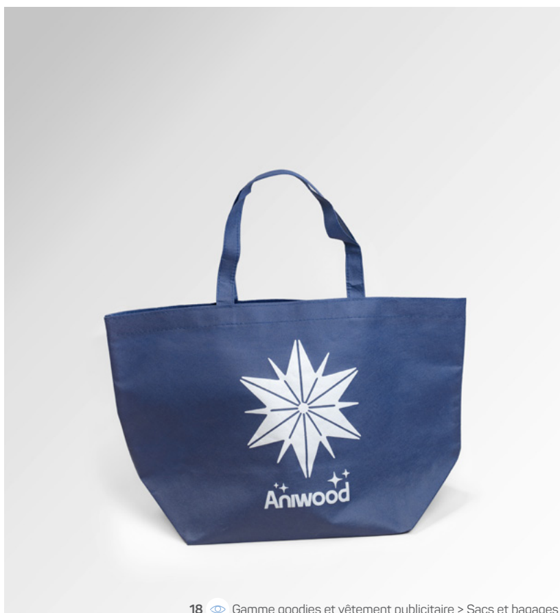
18 Gamme goodies et vêtement publicitaire > Sacs et bagages

Cercle 8 cm 150μ polypropylène holographique métallisé Quadri + blanc sélectif