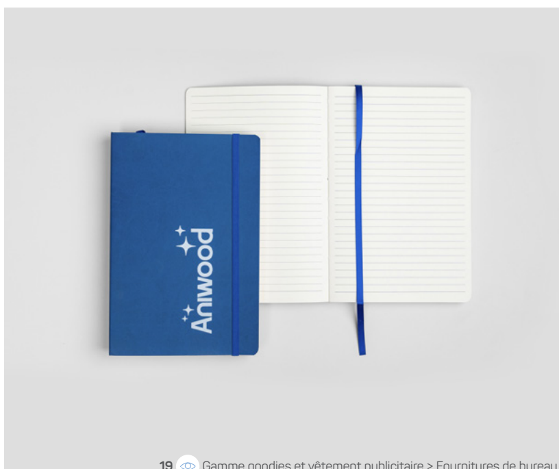
19 Gamme goodies et vêtement publicitaire > Fournitures de bureau