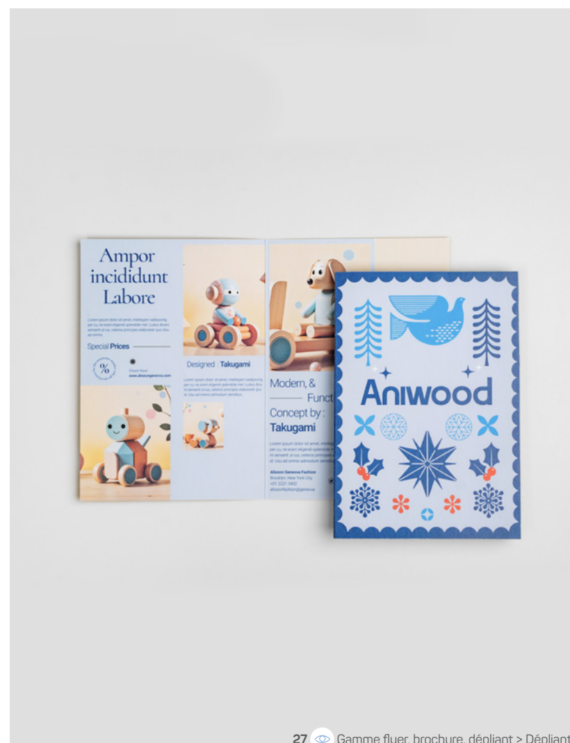
27 Gamme flyer, brochure, dépliant > Dépliant