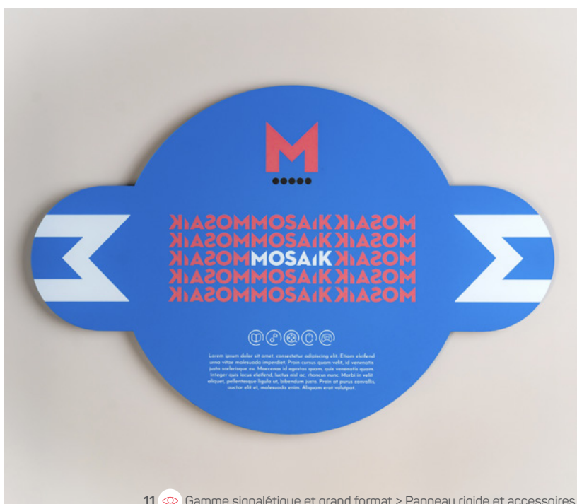
11 Gamme signalétique et grand format > Panneau rigide et accessoires