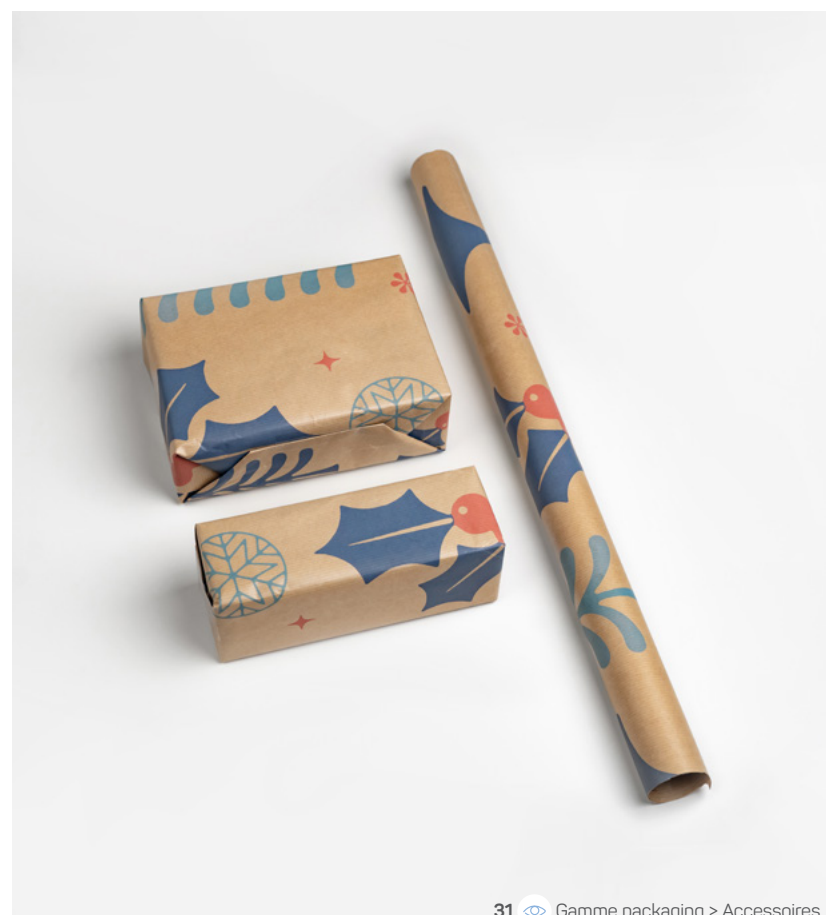
31 Gamme packaging &gt; Accessoires