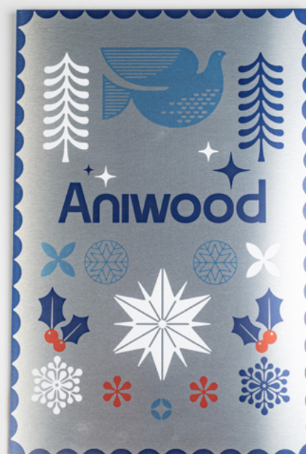
24 Gamme signalétique et grand format > Panneau rigide et accessoires