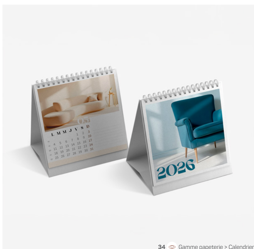
34 Gamme papeterie > Calendrier