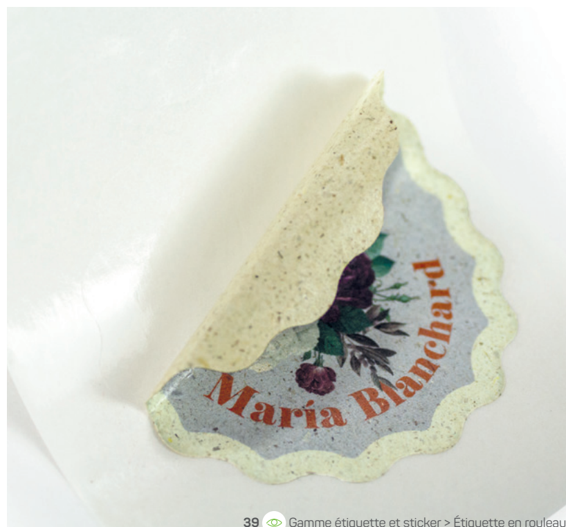
39 Gamme étiquette et sticker > Étiquette en rouleau

Quand écoresponsabilité rime avec créativité. Papier en fibres végétales, vinyle sans PVC, cartes en papiers alternatifs ou bâches éco-conçues : chaque support raconte un engagement. Parce que l'identité visuelle passe aussi par le choix des matières, ces produits recyclés valorisent à la fois votre univers et vos valeurs.