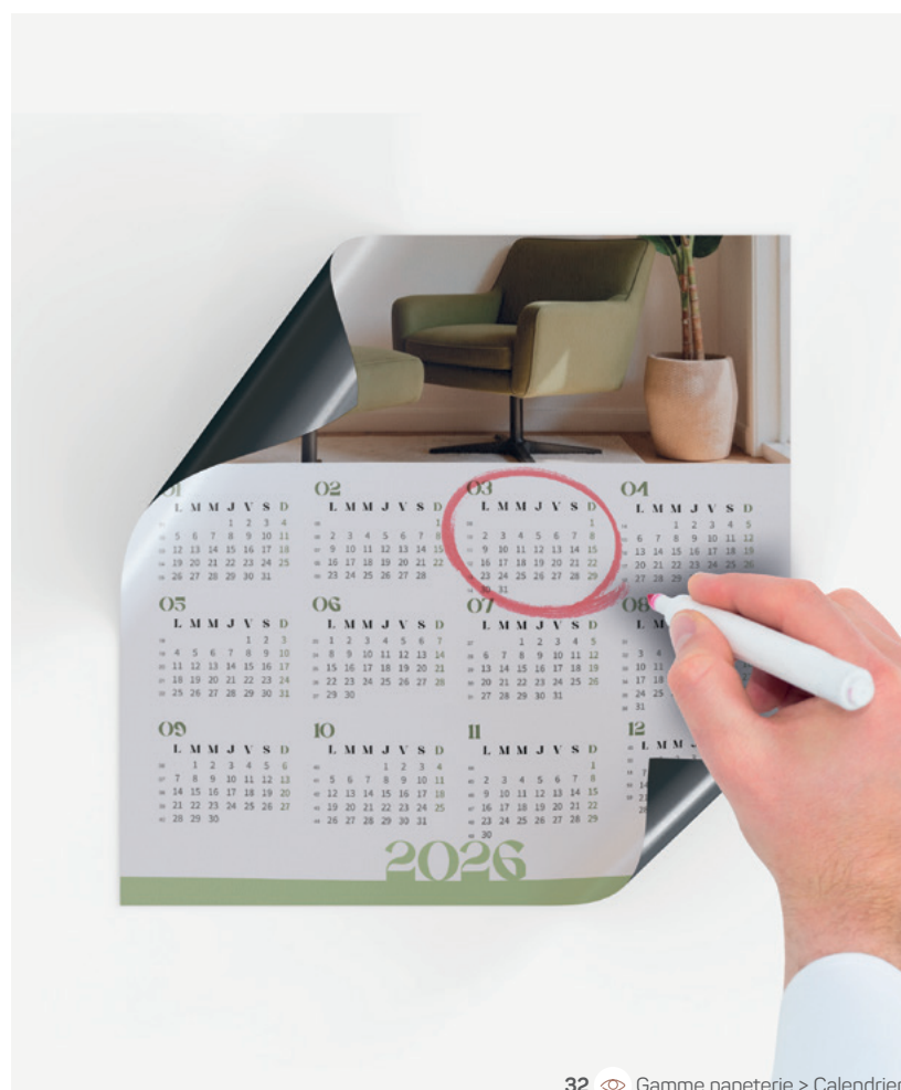
32 Gamme papeterie > Calendrier