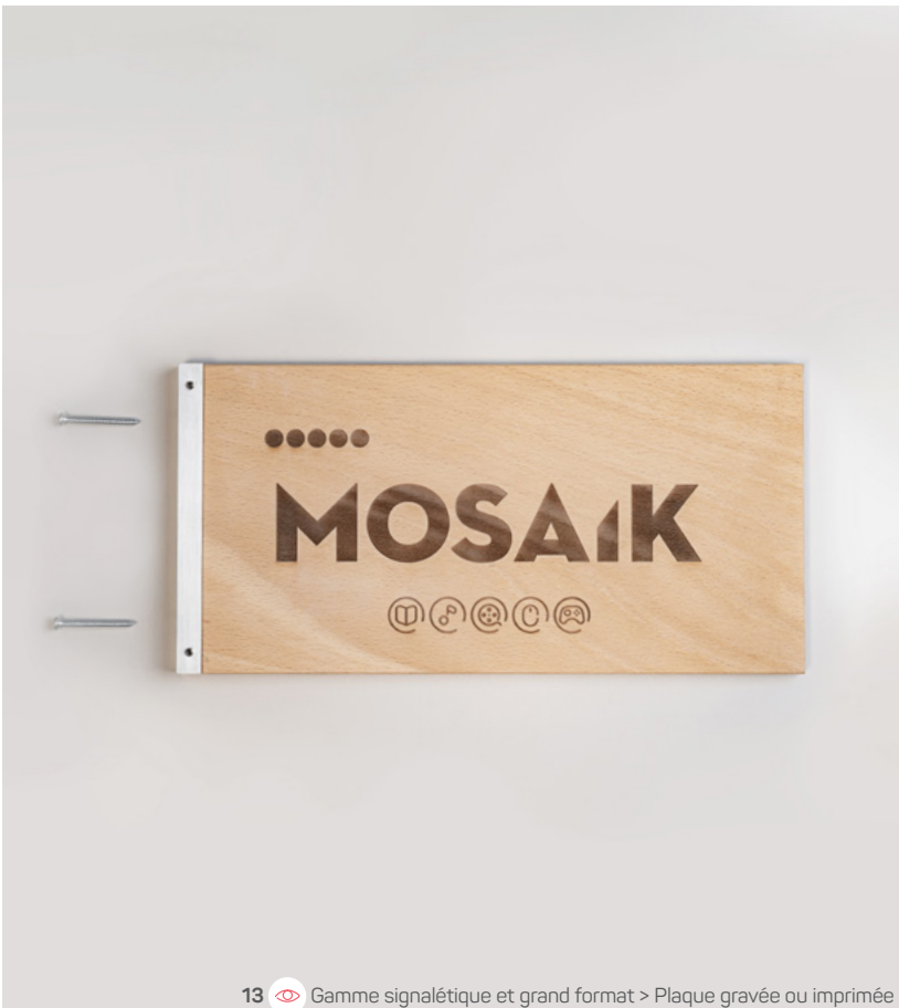
13 Gamme signalétique et grand format &gt; Plaque gravée ou imprimée