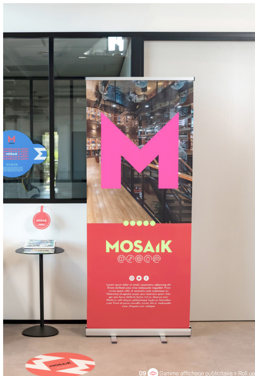
09 Gamme affichage publicitaire > Roll up