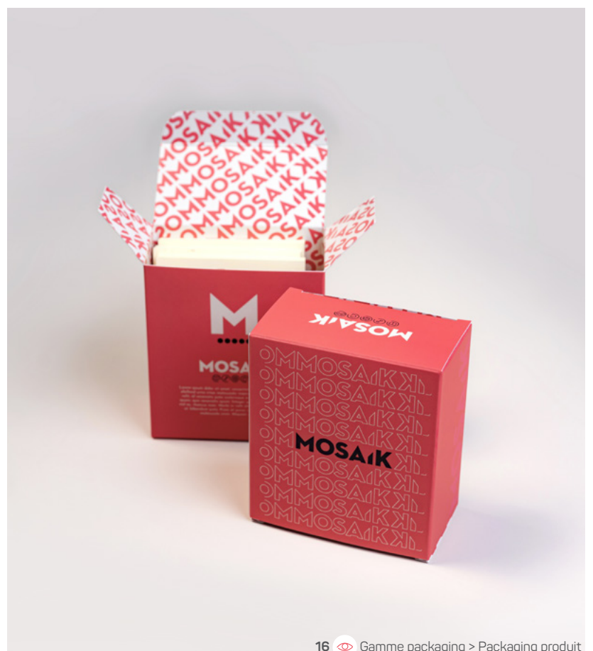
16 Gamme packaging &gt; Packaging produit