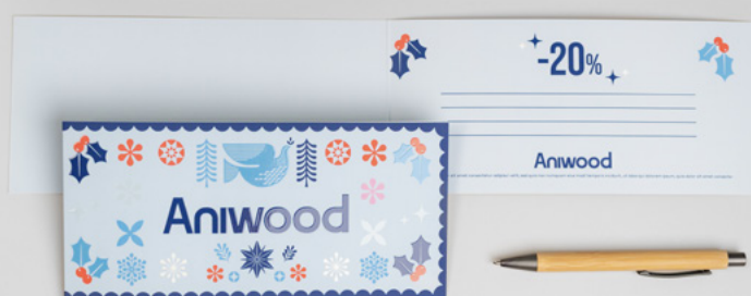
23 Gamme carterie > Carton invitation