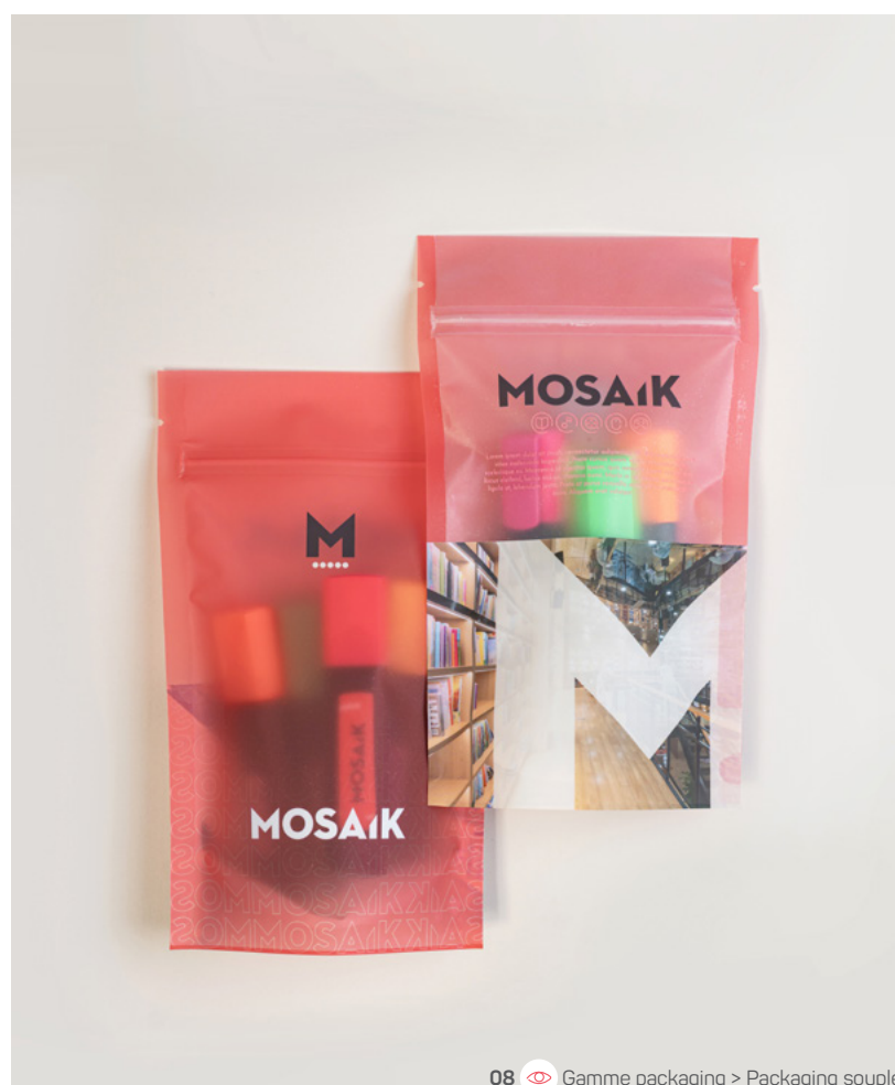
08 Gamme packaging > Packaging souple