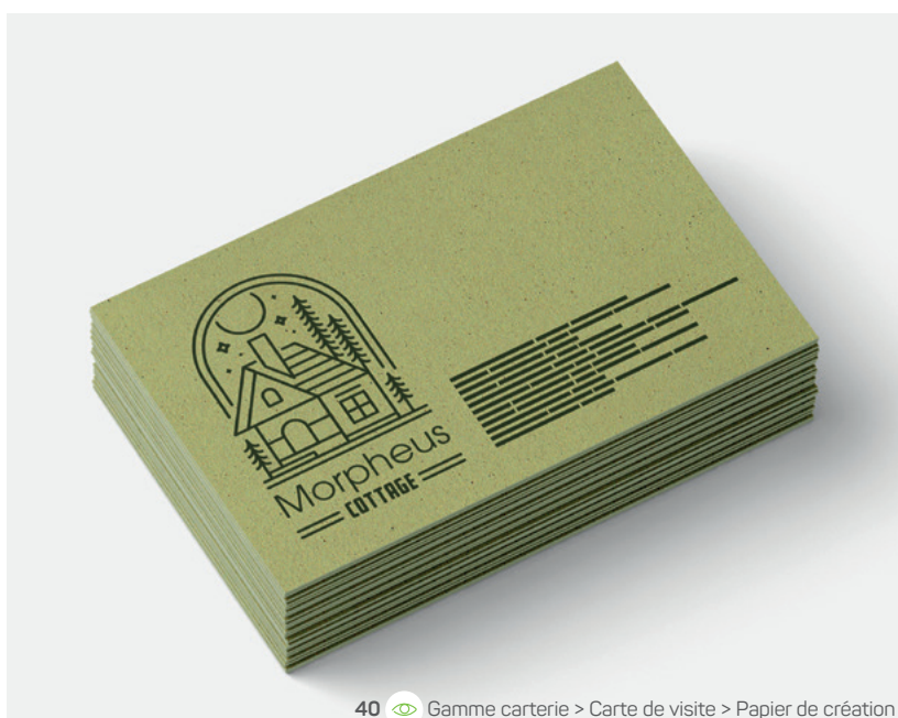
40 Gamme carterie > Carte de visite > Papier de création